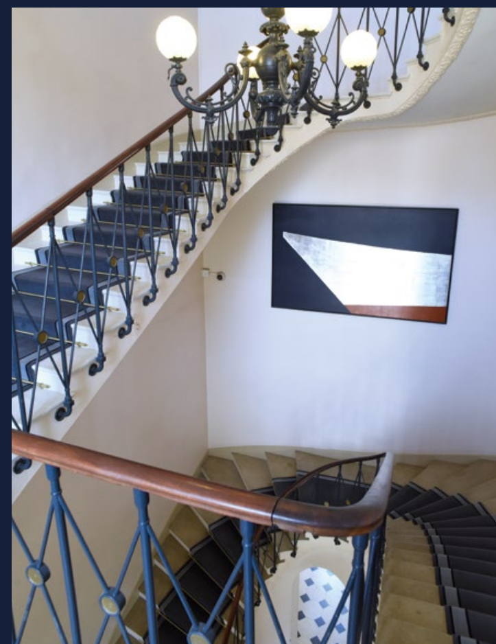
Demi Barque, Anna-Eva Bergman, acrylique et feuille de métal sur toile (années d'Antibes, 1973-1987)

À l'étage, le balcon-terrasse surplombe le porche et offre un point de vue exceptionnel sur le dôme du Panthéon et l'église Saint-Étienne-du-Mont, en plein cœur du 5 e arrondissement.