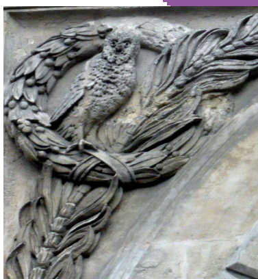
Frontispice du pavillon Joffre

Représentant ainsi le savoir et la science à travers les âges et les civilisations, la chouette est l'emblème de nombreuses institutions (écoles, universités), et notamment de l'École polytechnique.