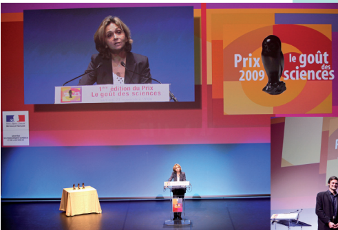
Cérémonie de remise du prix 2009 au Quai Branly