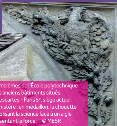
Les emblèmes de l'École polytechnique sur les anciens bâtiments situés rue Descartes - Paris 5 e , siège actuel du ministère : en médaillon, la chouette symbolisant la science face à un aigle représentant la force.